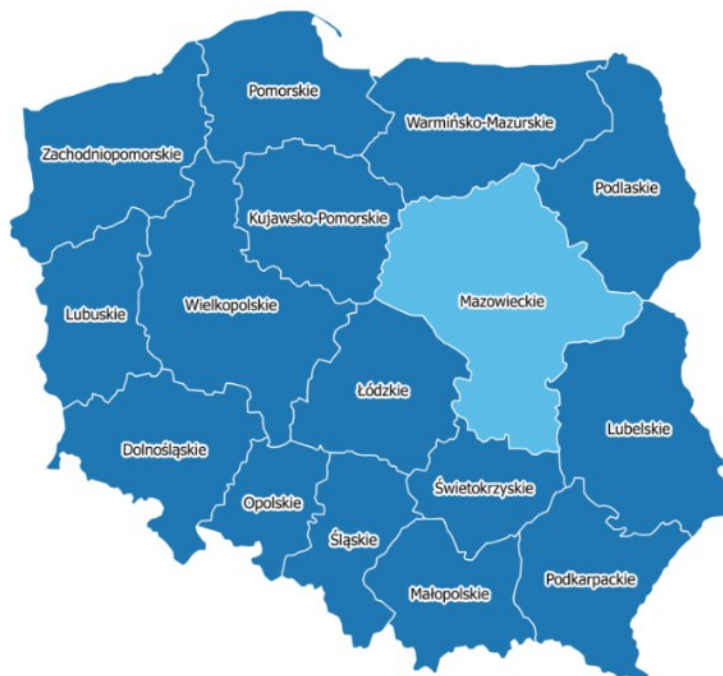
Rysunek 1 Położenie województwa mazowieckiego w Polsce 30

Wysokości bezwzględne rzadko przekraczają 200 m n.p.m. Najwyższym punktem jest wierzchołek Altany na Garbie Gielniowskim obok Szydłowca (408 m n.p.m.), a najniższy znajduje się na Wiśle koło Płocka (52 m n.p.m.). W kierunkach północ – południe województwo rozciąga się na długości 274 km, a wschód – zachód 265 km 29 .