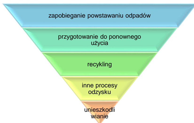
Rysunek 1. Hierarchia postępowania z odpadami 3

Poniżej przedstawiono hierarchię postępowania z odpadami wg art. 4 dyrektywy 1 , która dotyczy postępowania i gospodarowania odpadami. Należy dążyć w pierwszej kolejności do zapobiegania powstawaniu odpadów.