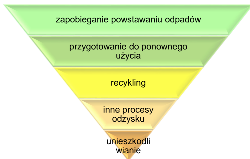
Rysunek 1 Hierarchia postępowania z odpadami

Powyżej [rys. 1] przedstawiono hierarchię postępowania z odpadami wg art. 4 Dyrektywy 2008/98/WE, która dotyczy postępowania i gospodarowania odpadami. Należy dążyć w pierwszej kolejności do zapobiegania powstawaniu odpadów.