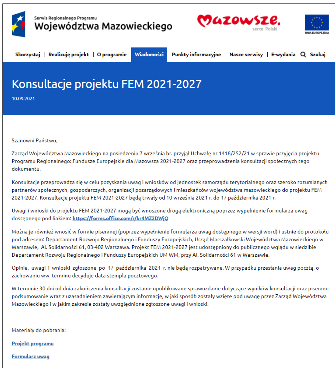
Fot. 1. Informacja pt. „Konsultacja projektu FEM 2021-2027”, opublikowana 10 września 2021 r. na stronie www.funduszedlamazowska.eu